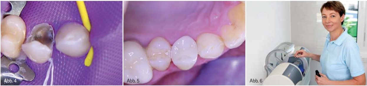
Abb. 4: Der Kofferdam hält die Präparation trocken und schafft so optimale Bedingungen für das Einsetzen der Restauration. – Abb. 5: Nach einer Stunde und 30 Minuten war die Restauration individualisiert und eingesetzt. Die Überprüfung der okklusalen Kontaktpunkte bestätigte die optimale Beschaffenheit der Restauration. – Abb. 6: Dr. Bernhild-Elke Stammnitz an der CEREC MCXL-Schleifmaschine.

Bevor die digitale Abformung erfolgt, legt der Anwender im CEREC-System den Patientenfall an und wählt die zu versorgenden Zähne sowie den Konstruktionsmodus aus. Da die Nachbarzähne vorhanden und in gutem Zustand waren, kam der Modus „Biogenerik individuell“ zum Einsatz.