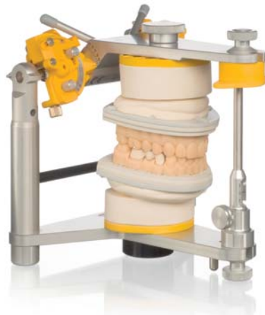
Abb. 7: Stereolithografisch gefertigtes Kunststoffmodell (SLA) im Artikulator (Sirona).

Prof. Gerwin Arnetzl, Universität Graz, verglich auf der Jahrestagung der DGCZ (Deutsche Gesellschaft für Computergestützte Zahnheilkunde) die Abformpräzision digital generierter Abformungen mit konventionellen Elastomerabdrücken. Wenn konventionelle Abformungen eine Rückstellung nach Verformung von 98,5 Prozent aufweisen, bedeutet das für eine Inlaykavität eine Passungengenauigkeit von 35 bis 75 µm. Dazu addieren sich bei Gussobjekten noch Toleranzen von 46,5 µm, sodass im indirekten Verfahren hergestellte Kronen literaturbelegte Abweichungen von 114 µm erreichen. Unterschiedliche elastomere Abformtechniken verursachen zum Teil erhebliche Abweichungen. So wurde bei analoger Abformung eine Abweichung von 49 µm bei Standardabformung und 122 µm bei Vergleichsabformung festgestellt. Brosky et al. stellten bei Polysiloxan-Abformungen Differenzen von 27 bis 297 µm fest. Die Untersuchungen zu analogen Abformverfahren waren in aller Regel jedoch 2-D-Vermessungen. Die neuen Studien zur Abbildungsgenauigkeit von lichtoptischen