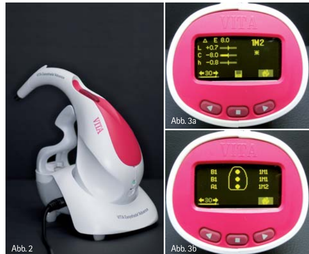
Abb. 2: Das Farbbestimmungssystem VITA Easyshade Advance. – Abb. 3a: Ermittelte Farbkoordinaten einer keramischen Restauration unter Verwendung des Farbbestimmungssystems VITA Easyshade Advance. – Abb. 3b: Farmmusterangaben im Rahmen einer Mehrpunktmessung am natürlichen Zahn.

Einen wesentlichen Vorteil dieser Systeme stellt, im Vergleich zur visuellen Farbbestimmung, die hohe Wiederholgenauigkeit dar. Sowohl in Labor- als auch in klinischen Untersuchungen konnten unter Verwendung dentaler elektronischer Farbbestimmungssysteme Zahnfarben hoch reproduzierbar ermittelt werden. Im Gegensatz dazu zeigte sich, dass die Ergebnisse der visuellen Farbnahme durch Umgebungsfaktoren ungünstig beeinflusst werden, wobei diverse Einflussfaktoren wie die Rotfärbung der an den Zahn angrenzenden Schleimhaut, die Krümmung der Zahnoberfläche, die Speichelbenetzung des Zahnes und Bewegungen des Patienten während der Farbnahme eine wichtige Rolle spielen. Weiterhin ermöglichen elektronische Farbbestimmungssysteme die Bestimmung von Farbkoordinaten, mithilfe derer die zu bestimmenden Farben und Farbunterschiede exakt charakterisiert werden können (Abb. 3a). Solchen Farbkoordinaten werden im Anschluss unter Verwendung spezieller Algorithmen Zahnfarben (VITA classical A1–D4 oder VITA 3D-MASTER) zugeordnet (Abb. 3b). Darüber hinaus besteht die Möglichkeit, während des Herstellungsprozesses einer zahn-