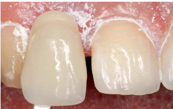
Abb. 5: Zahnfarbestimmung.

Bei der Herstellung von Marylandbrücken aus Lava™ Zirkonoxid müssen die Konnektorenflächen zwischen Flügel und Brücken-