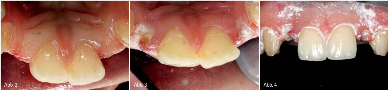
Abb. 2: Situation nach Entfernen der insuffizienten Versorgungen. – Abb. 3: Situation nach Präparation... – Abb. 4: ... und Beschichtung mit Scanpuder.

ein dreidimensionales Modell auf dem Monitor erstellt. Eine Zusammensetzung von Einzelbildern mit rechnerischen Ungenauigkeiten entfällt vollständig. Somit kann eine Präzision von unter 10 µm Abweichung bei der Herstellung von CAD/CAM-gemertem Zahnersatz erreicht werden. Im speziellen 3-D-Video-Modus kann jeder Zahn nach der Präparation durch den Zahnarzt begutachtet und – wenn notwendig – korrigiert werden. Ein weiterer wesentlicher Vorteil von Videoscannern besteht in einer perfekten Zuordnung von Ober- und Unterkiefer. Die Kieferrelationsbestimmung stellt den Zahnarzt immer wieder vor eine große Herausforderung. Mithilfe des 3-D-Video-Modus können die gescannten Ober- und Unterkiefer perfekt zueinander justiert und kontrolliert werden. In jedem Fall ist bei diesen modernen Innovationen der Patient der Gewinner. Höchste Präzision, verbunden mit hohem Behandlungskomfort, lassen digitale Systeme zunehmend in Zahnarztpraxen Einzug halten. Anhand eines klinischen Falles soll der digitale Workflow ausführlich erläutert werden.