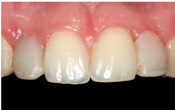
Abb. 1: Ausgangssituation.

Videoscanner erfassen hingegen mit der sogenannten 3D-in-Motion-Technologie kontinuierlich 3-D-Videobilder (bis zu 20 Millionen Bildpunkte pro Kiefer). Hieraus wird in Echtzeit