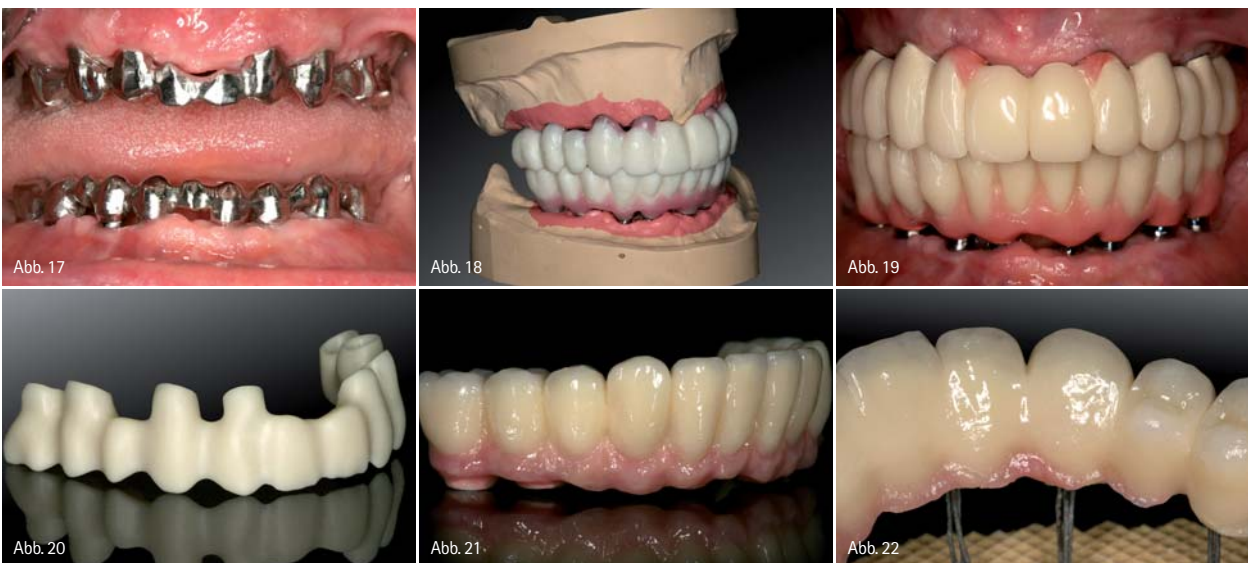
Abb. 17: Gerüsteinprobe für Langzeitprovisorium (Therapeutikum). – Abb. 18: Wachsauflstellung der Ober- und Unterkieferzähne für die Ästhetikeinprobe. – Abb. 19: Kunststoffverblendete Langzeitprovisorien (LZP) auf Metallbasen zur muskulären Kiefergelenkadaptation, vor der Herstellung des definitiven implantatgetragenen Zahnersatzes. – Abb. 20: CAD/CAM-generiertes Zirkon-Brückengerüst aus demselben virtuellen Datensatz wie das LZP. – Abb. 21 und 22: Verblendete, vollkeramische Zirkonbrücken nach Fertigstellung im Labor.

Der Einsatz computergestützter Fertigungstechnologien zur Herstellung von implantatgetragenem Zahnersatz oder Teilen davon ist dabei für viele Anwender in Labor und Praxis zur Realität geworden. Neue CAD/CAM-Techniken setzen voraus, dass