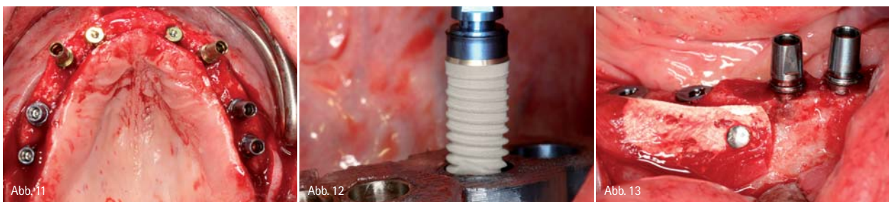
Abb. 11: Zustand nach Implantatinserion im Oberkiefer, Implantate in situ. – Abb. 12: Schablonengeführte Implantatinserion im Unterkiefer (XIVE® Ø 4,5mm, DENTSPLY Friadent). – Abb. 13: Knochenaugmentation und Fixierung des Augmentates mit resorbierbarer Membran und Membrannägeln (Bio-Oss®, Geistlich).

In der oralen Implantologie ist eine präzise präoperative Planung zur Realisierung der Implantatposition aus chirurgischer