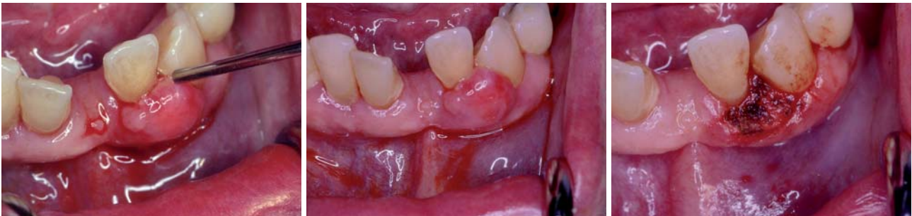
Abb. 1–3: Fibromentfernung mittels Laserschnittführung. Hier hätten sämtliche in der Zahnheilkunde etablierten Laser, wie CO 2 /Diode/Er:YAG/Er,Cr:YSGG und Nd:YAG, zum Einsatz kommen können.

Immerhin dreiundzwanzig Jahre musste die deutsche Zahnärzteschaft auf eine Novellierung der Gebührenordnung für Zahnärzte warten. Entsprechend hoch waren die diesbezüglichen Erwartungen.