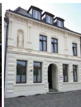
Laserzentrum Nord, Damme.

startet, die mindestens einmal jährlich zu wechselnden Schwerpunktthemen mit internationalen Experten aus Praxis und Wissenschaft die neusten Erkenntnisse vorstellen und beleuchten. Im Mai 2012 wurde erstmals eine gesamte Fortbildungsveranstaltung im Internet übertragen. Für laserinteressierte Zahnärzte, die sich über Technik und Einsatzmöglichkeiten ein eigenes Bild machen möchten, werden in verschiedenen deutschen Städten seit 2012 kostenfreie Informationsabende angeboten.