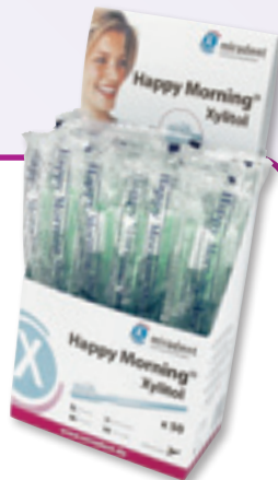
Happy Morning Xylitol (50 St.), REF 605 496