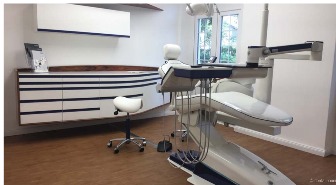
Die Ausstellung in der Grunewalder Villa zeigt eine exklusive Auswahl und ermöglicht eine breit gefächerte Beratung.

Wir wollen trotz der Corona-Pandemie unsere gesetzten Ziele im Jahr