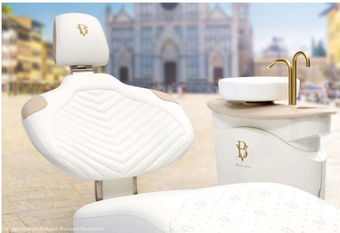
Bella Vita ist die neue Design-Behandlungseinheit für die kieferorthopädische Praxis.

„Die Idee zu Bella Vita entstand aus einer Vielzahl von Einzelgesprächen mit etablierten Kunden wie auch Neukunden, die definitiv wegen DESIGNKONZEPT db auf uns zukamen. Offen gestanden kam zwar