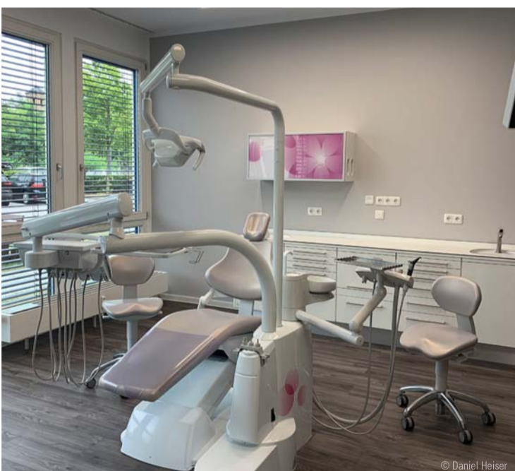
Im Showroom können Kunden hochwertige Behandlungseinheiten persönlich in Augenschein nehmen.

Der neue dental bauer Kompetenzstandort in der Händelstadt lädt interessierte Teams aus Zahnarztpraxen und Dentallaboren zum individuellen Wunschtermin.