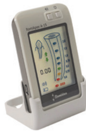
American Dental Systems